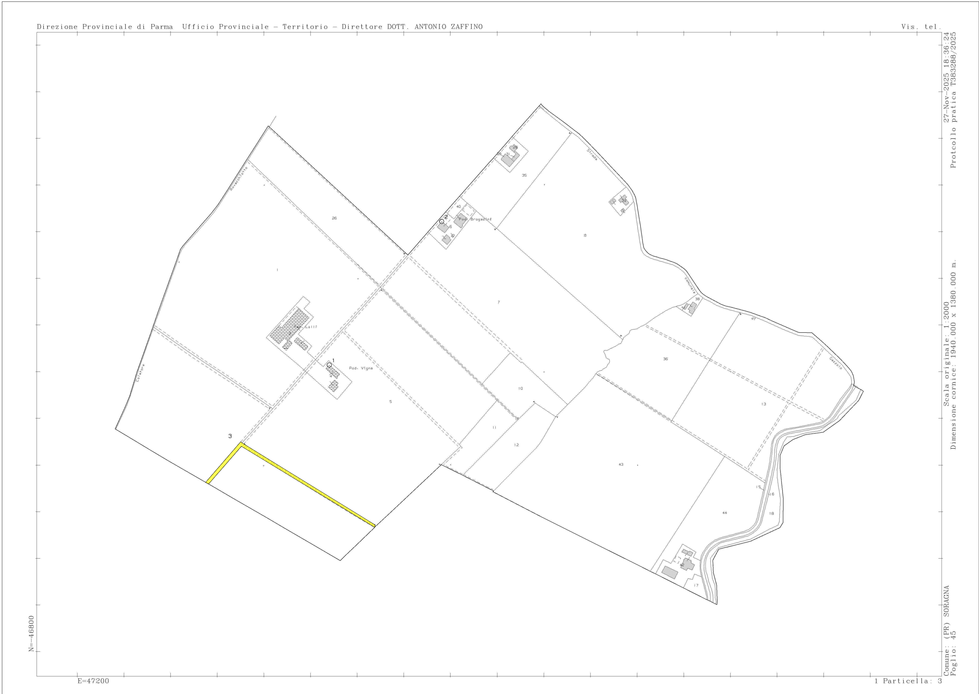
ESTRATTO DI MAPPA CATASTALE COMUNE DI SORAGNA FG 45 - scala 1:2000